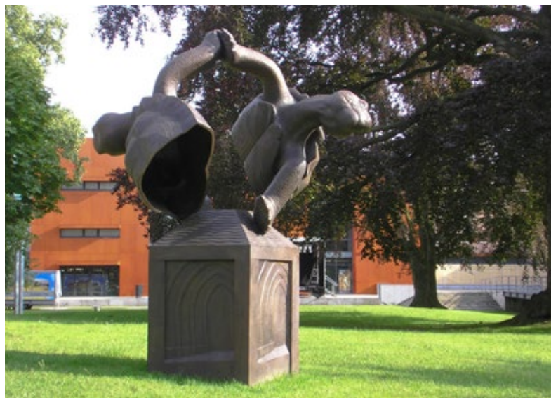
'Dansende schildpadden' in de Muzentuin