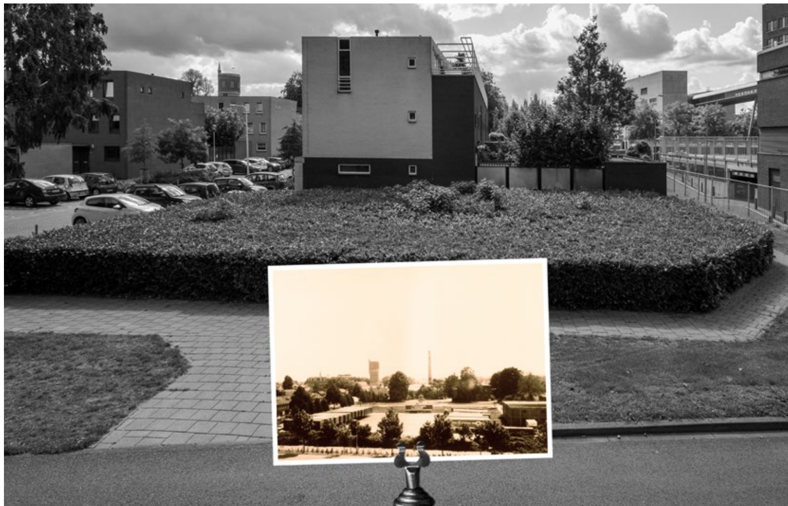
Ansichtkaart: Deze is in de jaren 70 gemaakt ter hoogte van waar nu het fietspad lepenpad en lepenstraat loopt. De nieuwe foto is weer op dezelfde plek gemaakt. Op de achtergrond zie je de Watertoren aan de Bredaseweg, rechts vooraan het politiebureau aan de Ringbaan West (gebouwd in 1996) en rechts achter het CZ-gebouw (uit 1994). Op het voormalige terrein links, waar de vrachtwagens werden geladen en gelost, zijn later de woningen van de Taxusstraat en Magnoliaerf gebouwd.